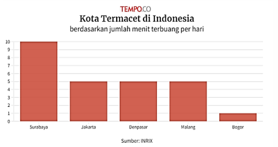
Gambar 1. Surabaya Kota Termacet di Indonesia Tahun 2021

pada 2021, menggeser Kota Jakarta di tingkat global.