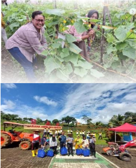
Gambar 3. Sarana Prasarana Lapas Kelas I Madiun (foto atas) & Lapas Kelas I Malang (foto bawah)