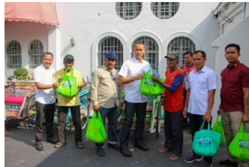
Gambar 4. Keterlibatan Kakanwil dan Kalapas dalam Implementasi Bantuan Sosial di UPT Pemasarakatan

Di level Unit Pelaksana Teknis Pemasarakatan, komunikasi instruktif terjalin antara Kepala UPT dan jajarannya melalui rapat dan musyawarah. Forum-forum ini menjadi sarana untuk memberikan arahan lebih lanjut mengenai skema pelaksanaan program bantuan sosial, termasuk pendelegasian tanggung jawab seperti penetapan sasaran penerima. Hal ini menunjukkan adanya inisiatif internal UPT dalam menjabarkan tugas, meskipun panduan dari pusat bersifat umum. Selanjutnya, mengenai distribusi informasi kepada penerima program bantuan sosial ini dilakukan melalui berbagai saluran, baik daring (via YouTube, Instagram, dan situs web resmi) maupun secara luring (melalui interaksi langsung, seperti saat layanan kunjungan). Keterlibatan aktif Kepala Kantor Wilayah maupun Kepala UPT dalam sosialisasi luring selama pelaksanaan kegiatan bantuan sosial semakin menegaskan pentingnya upaya komunikasi dalam implementasi kebijakan bantuan sosial. Melalui komunikasi yang baik, diharapkan informasi terkait program bantuan sosial dapat tersampaikan secara luas, baik antara pihak pelaksana dengan pihak penerima manfaat. Dengan demikian, tujuan dari program tidak hanya dipahami oleh pihak pelaksana, tetapi juga dimengerti oleh para penerima bantuan, sehingga pelaksanaannya dapat berjalan lebih tepat sasaran dan bermakna.