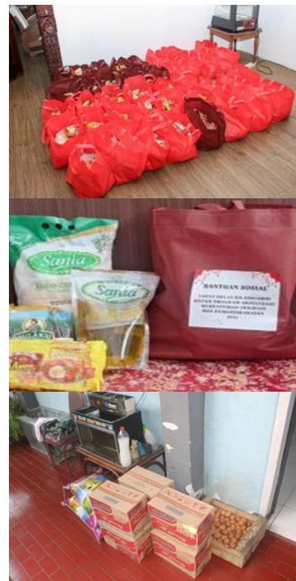
Gambar 2. Bentuk Bentuk Paket Bantuan Sosial yang Disalurkan

komitmen kuat dan kesiapan sumber daya dalam mendukung program pemerintah, khususnya melalui pemanfaatan potensi internal seperti hasil pembinaan warga binaan dalam pelaksanaan program bantuan sosial. Meskipun demikian, terdapat perbedaan yang mencolok dalam bentuk dan kuantitas paket bantuan yang disalurkan oleh setiap UPT, yang mengindikasikan kurangnya keseragaman implementasi. Ketimpangan ini semakin terlihat jelas, karena tidak semua UPT Pemasarakatan menunjukkan tingkat aktivitas yang setara, meskipun beroperasi dalam wilayah administratif yang sama. Dengan demikian, dinamika yang muncul sangat dipengaruhi oleh kapasitas masing-masing UPT Pemasarakatan dalam mengimplementasikan kebijakan yang telah ditetapkan. Berikut adalah beberapa dokumentasi mengenai bentuk paket bantuan sosial yang didistribusikan jajaran UPT Pemasarakatan di lingkungan Kantor Wilayah Direktorat Jenderal Pemasarakatan Jawa Timur, sebagai bukti konkret yang membuktikan kondisi saat ini.