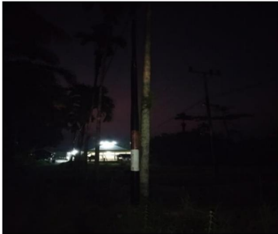
Gambar 5. Kondisi Lampu Penerangan Jalan Umum yang Mati di Nagari Sitalang, Kecamatan Ampek Nagari, Kabupaten Agam

dibandingkan proaktif mencerminkan kelemahan dalam sistem monitoring preventif.