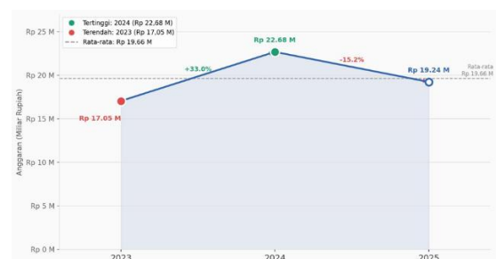
Gambar 4. Grafik Penurunan Anggaran Penerangan Jalan Umum Dinas Perhubungan Kabupaten Agam (2023–2025)

Pada aspek perencanaan, Dinas Perhubungan mengalami keterbatasan signifikan akibat efisiensi anggaran dari pemerintah pusat. Grafik penurunan anggaran PJU (Gambar 4) menunjukkan penurunan berturut-turut dari tahun 2023 hingga 2025. Kepala Dinas Perhubungan menegaskan bahwa perencanaan dilakukan berdasarkan skala prioritas mengingat anggaran yang sangat terbatas (wawancara, 2026). Implikasinya, sebagian keluhan masyarakat mengenai kerusakan lampu harus menunggu giliran penganggaran periode berikutnya (Ferza & Pranasari, 2020).