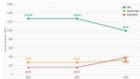
Gambar 2. Panjang Jalan Menurut Status dan Kondisi Permukaan Jalan