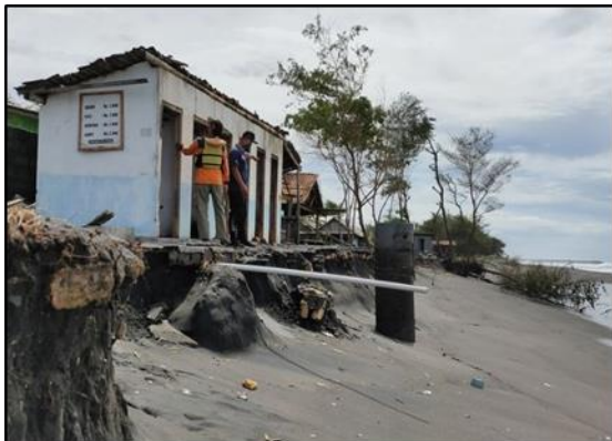
Gambar 4. Kondisi Kamar Mandi Pantai Glagah